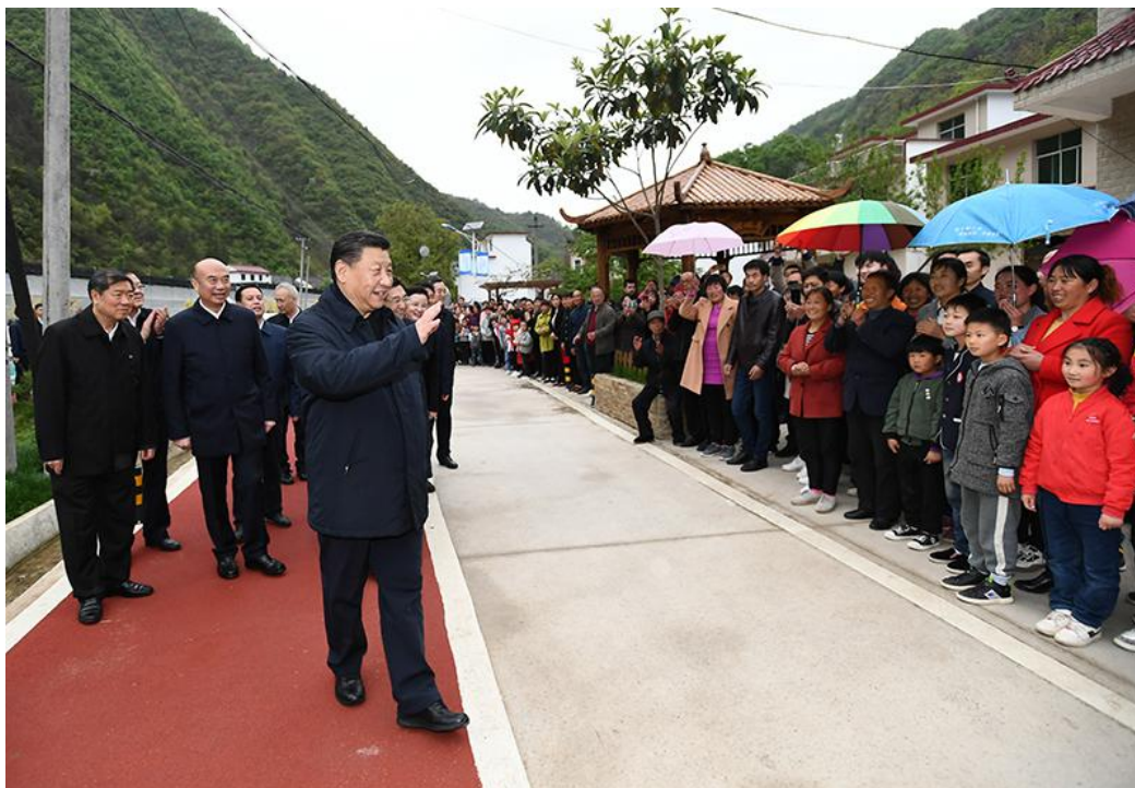
4月20日至23日，中共中央总书记、国家主席、中央军委主席习近平在陕西考察。这是4月20日，习近平在商洛市柞水县小岭镇金米村考察时，向村民们挥手致意。