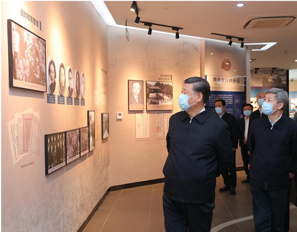
4月20日至23日，中共中央总书记、国家主席、中央军委主席习近平在陕西考察。这是4月22日，习近平在西安交通大学交大西迁博物馆参观。