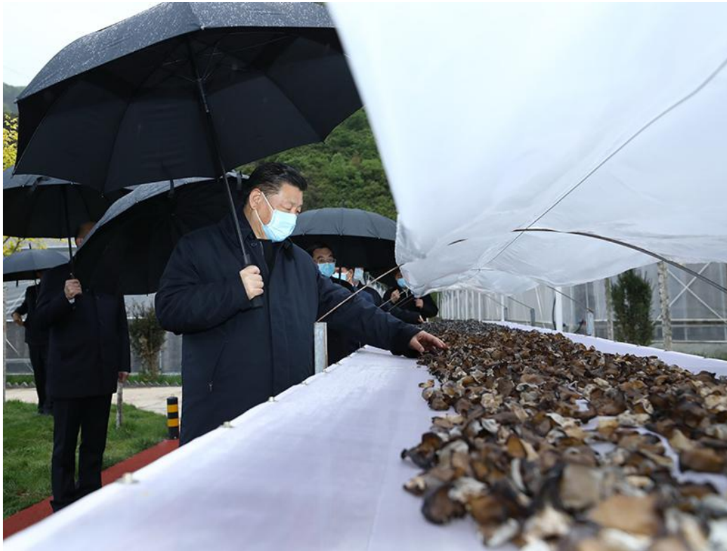
4月20日至23日，中共中央总书记、国家主席、中央军委主席习近平在陕西考察。这是4月20日，习近平在商洛市柞水县小岭镇金米村，了解该村发展木耳产业情况。