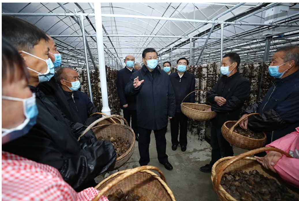
4月20日至23日，中共中央总书记、国家主席、中央军委主席习近平在陕西考察。这是4月20日，习近平在商洛市柞水县小岭镇金米村智能联栋木耳大棚，同村民亲切交流。